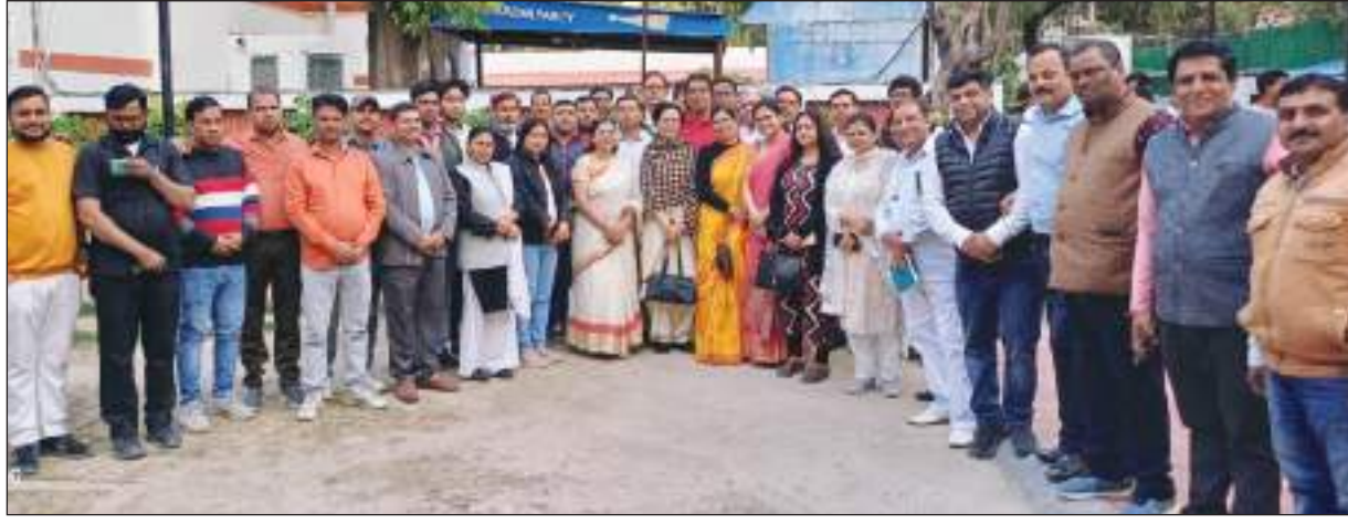
के प्रदेश कार्यालय में किया गया। तो वहीं इस कमेटी की मॉनिटरिंग स्वयं मुख्यमंत्री अरविंद केजरीवाल करेंगे

आयोजन किया। जिसमें विधानसभा स्तर पर आरडब्ल्यूए के पदाधिकारियों की नियुक्ति की गई। कार्यक्रम का आयोजन दिल्ली के आईटीओ स्थित आम आदमी पार्टी