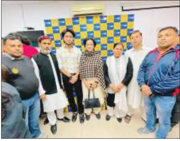
टीएम एक्शन इंडिया नई दिल्ली: दिल्ली में लोकसभा चुनावों को देखते हुए आम आदमी पार्टी ने राज्य स्तरीय पर आरडब्ल्यूए की बैठक का

आयोजन किया। जिसमें विधानसभा स्तर पर आरडब्ल्यूए के पदाधिकारियों की नियुक्ति की गई। कार्यक्रम का आयोजन दिल्ली के आईटीओ स्थित आम आदमी पार्टी